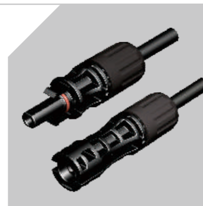
连接器 | CONNECTOR

THE PRODUCTION OF PHOTOVOLTAIC MATERIAL SOLUTIONS