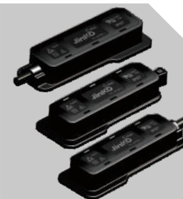
接线盒 | JUNCTION BOX