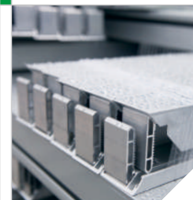
铝边框 | ALUMINUM FRAME